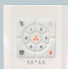
Option: télécommande murale fixe en saillie ou encastrable (Alimentation à piles ou en 220volts)